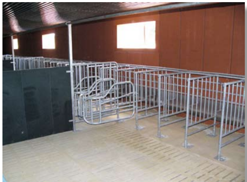
Aménagement Gévispace avec Panier et logettes