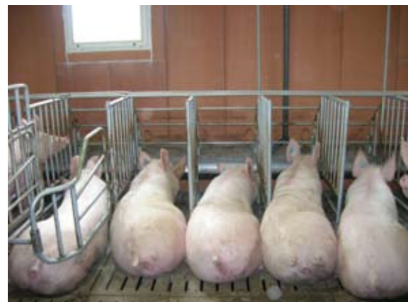
Les truies sont calmes, pas de risque de concurrence